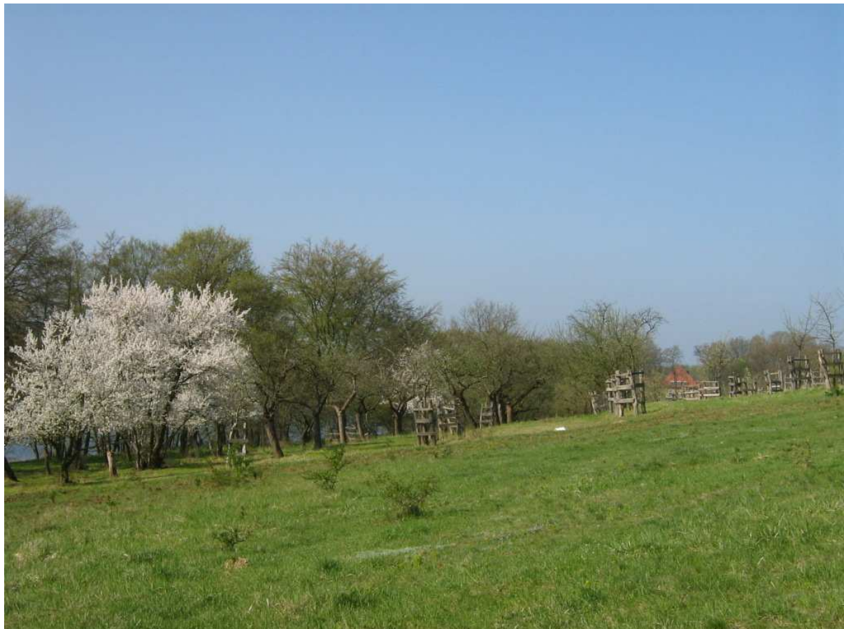
Obstwiese Seewalde – zwischen See und Wald ....